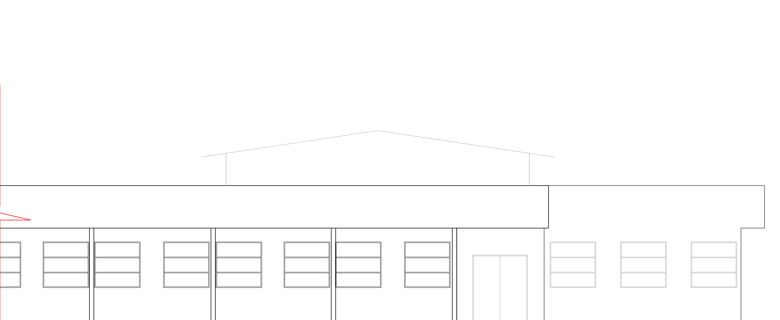
ELEVAÇÃO 01 (02) ESCALA 1:100